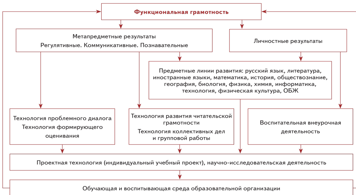
Схема «Система работы школы по обеспечению личностных и метапредметных (УУД) результатов школьников»

Из схемы видно, что существует несколько механизмов развития личностных и метапредметных результатов: