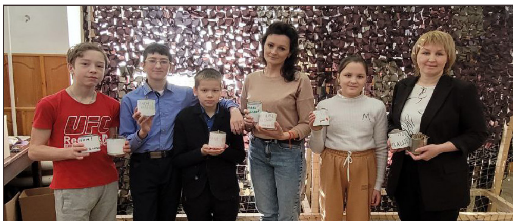
Чапаевцы научились создавать блиндажные свечи и маскировочные сети, необходимые бойцам.