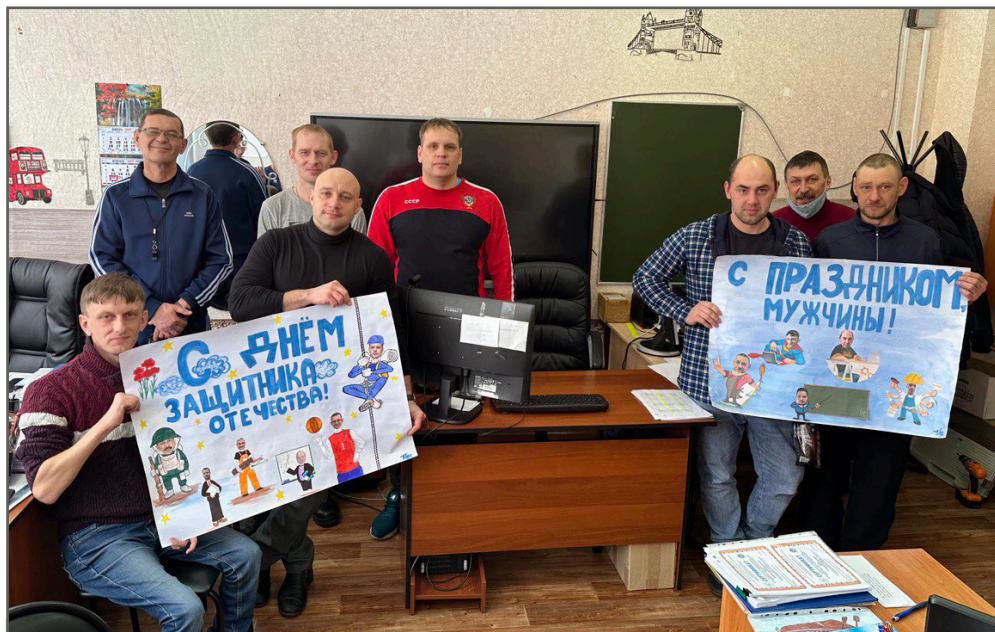
Волонтёры школы №2 поздравили всех мужчин с Днём защитника Отечества, выразив им с помощью плакатов признательность и уважение. Кроме того, виновникам праздника были вручены памятные подарки.